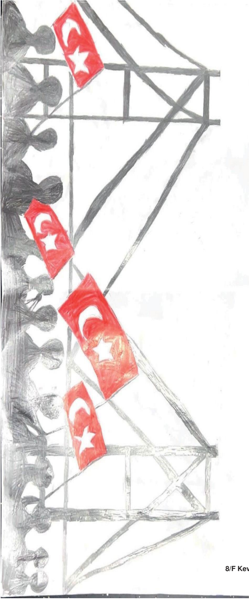
8/F Kevser COŞKUN

BU DARBE UNUTULMAYACAK VE UNUTTURULMAYACAKTIR.